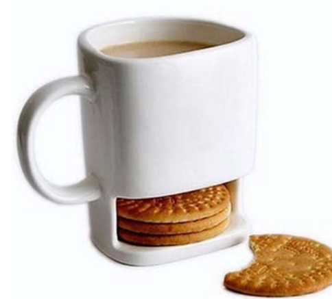
7 / Dunk Mug Mocha Casa

La grande chaîne de cafés internationale souhaite maintenant s'inspirer des exemples ci-dessous pour proposer d'autres fonctions :