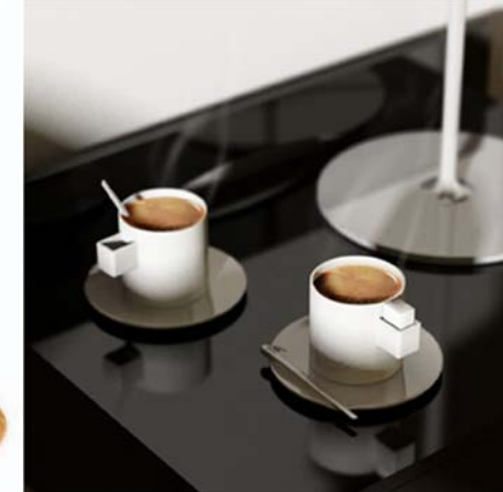
8 / Place au sucre Grrr design, 2008