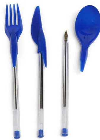
4 / Din Ink Bic Cristal Design Zo Loft, 2015

a) Dessiner les formes de l'objet existant et de son complément d'objet. Identifier leur(s) fonction(s) à l'aide d'un verbe (il peut y en avoir deux au maximum).