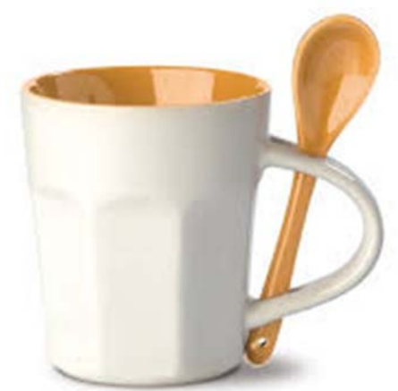
9 / Mug avec cuillère

g) Expliquer la nouvelle fonction de ces dispositifs à l'aide d'un verbe.