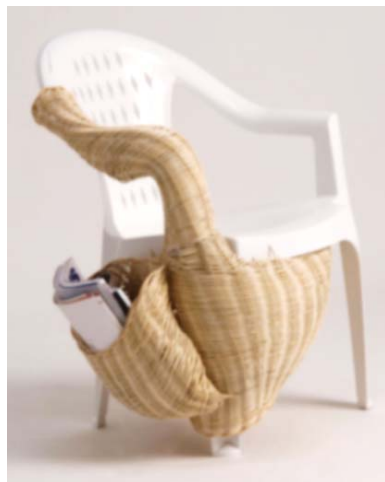
1 / Viminibidi Giulia Cavazzani, 2012 Source : www.abitare.it