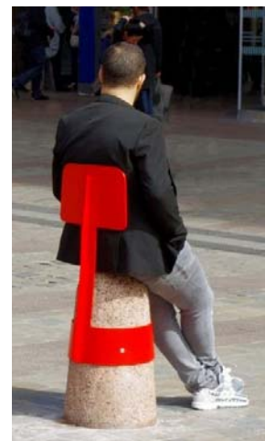
2 / C - Boll Adrien Blanc, 2008