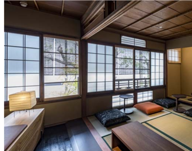
11 / Taichi Yamamoto, Extérieur et intérieur d'un café, Kyoto, 2017.

a) Relever graphiquement les formes des décors des intérieurs des cafés des visuels 10 et 11.