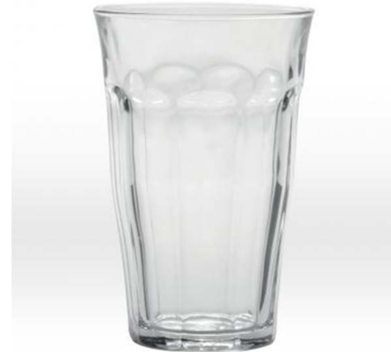
PROPOSITION POUR LE CAFÉ DE KYOTO