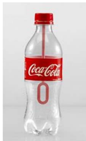
3 / Bouchon Coca-Cola Agence Ogilvy, 2014