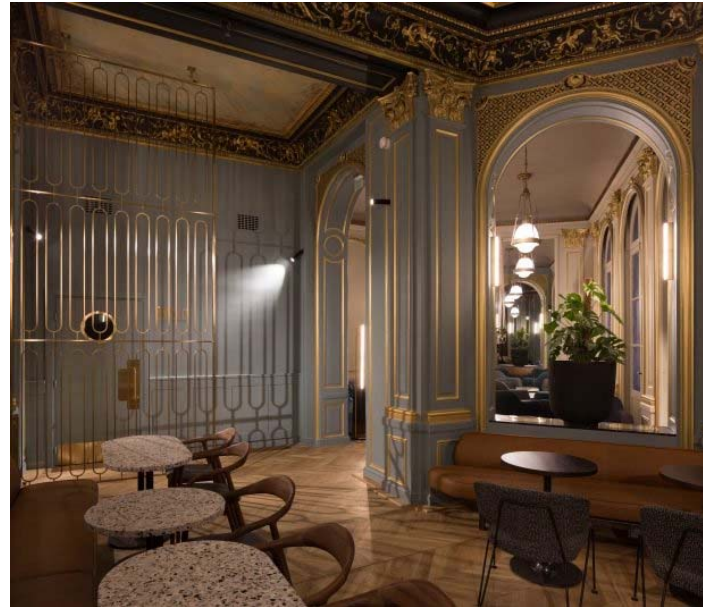
10 / Thierry Della Rovere, Intérieur d'un café, Paris Capucines, 2012.